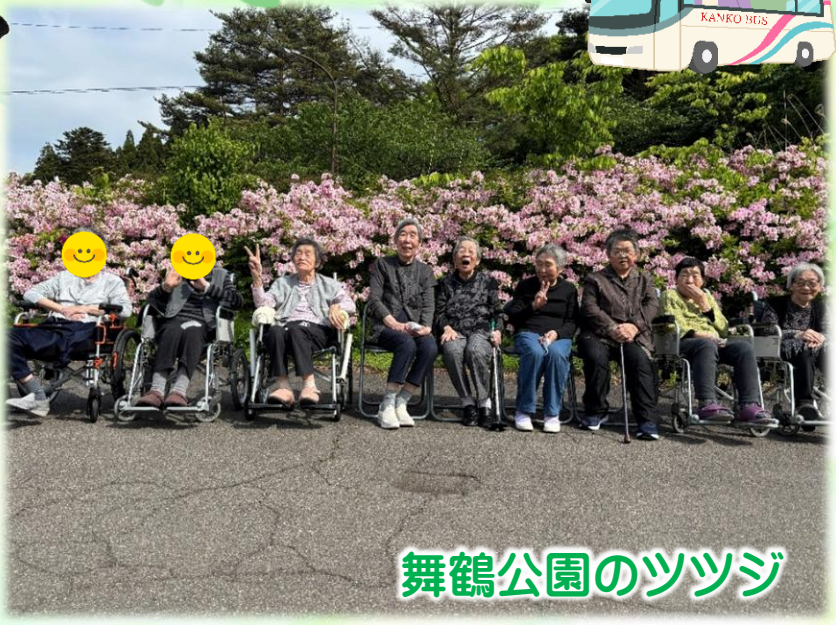
舞鶴公園のツツジ

ほづみショートステイは天気の良い日は出掛けます。施設の中にいるだけでは感じにくい「季節の風」「花の香り」「風景」などを肌で感じてもらいたいと考えています。これからもいろいろな企画しますので、楽しみにして下さいね。