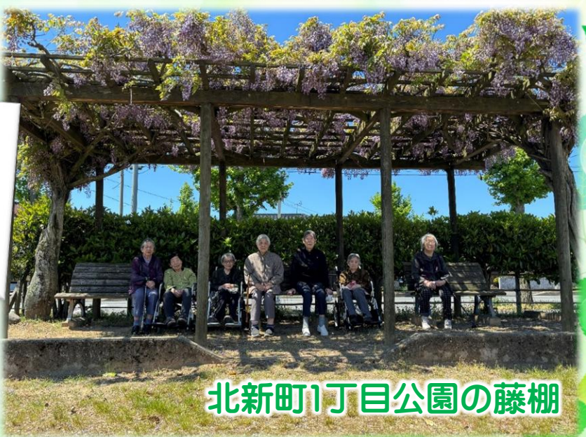
北新町1丁目公園の藤棚