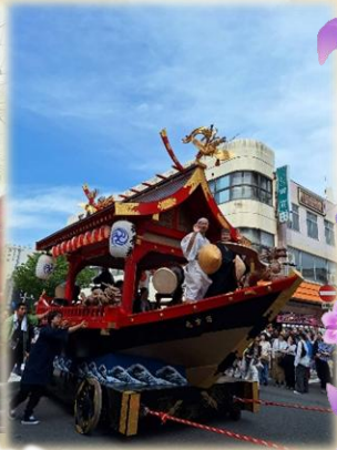
山車行列や獅子パッケン