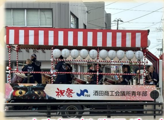
祝祭 YEO 酒田商工会議所青年部

上下両日枝神社の例大祭として一六〇九年から一度も休むことなく続いている酒田まつりを見学に行きました。山車行列には二〇〇〇人が参加し、酒田ばやしが響き渡っていました。