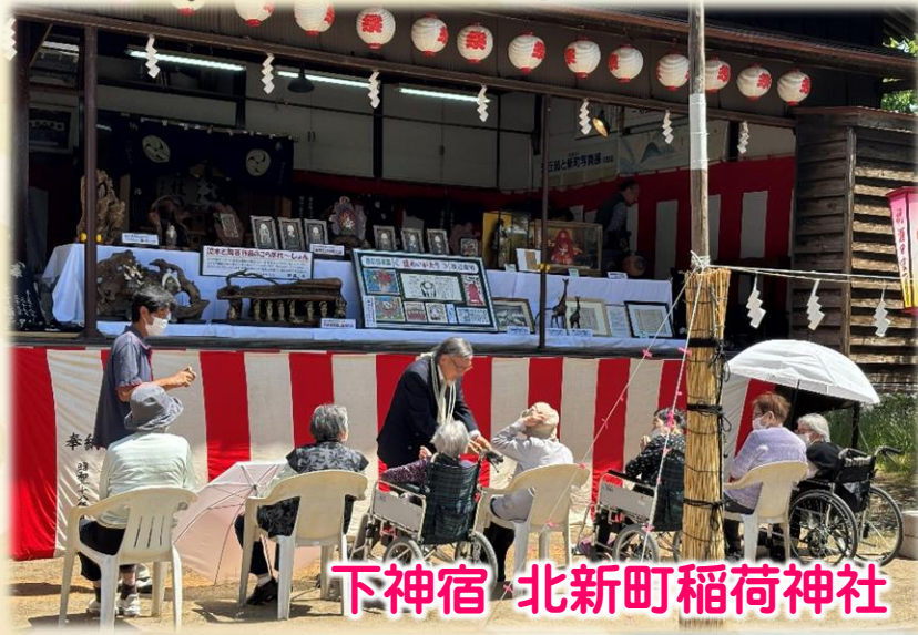
下新宿 北新町稲荷神社

上下両日枝神社の例大祭として一六〇九年から一度も休むことなく続いている酒田まつりを見学に行きました。山車行列には二〇〇〇人が参加し、酒田ばやしが響き渡っていました。